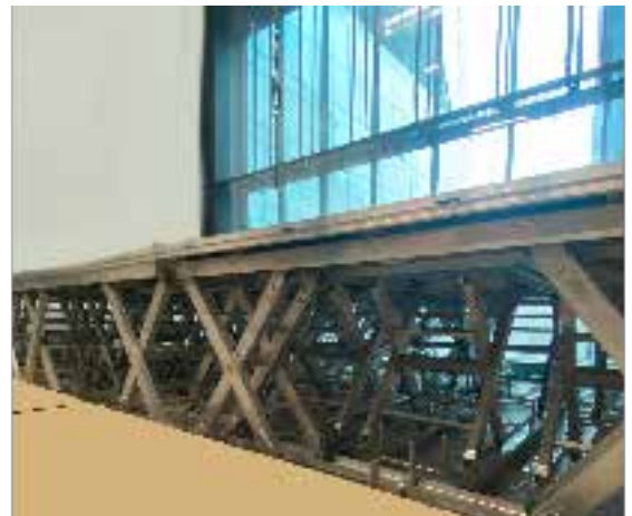
SHOWLIFT PENDANT L'INSTALLATION AU MASSEY HALL