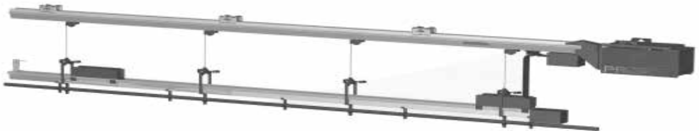
VUE DU CÔTÉ DROIT